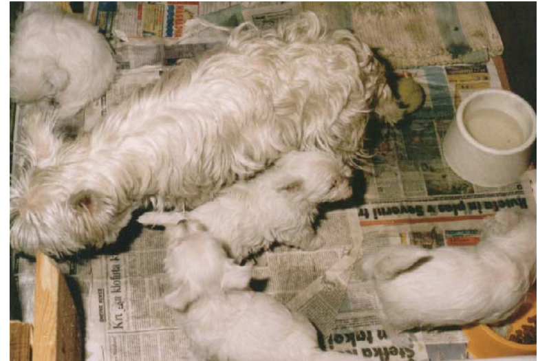
Upi (skrajno desno) s svoji sedmimi brati in sestrami

Nato smo ga iskali po malih oglasih, klicali po telefonu in šli pogledat višavskega terierja v Ljubljano k Hočevarjevim, staršem Simona Hočevarja, ki tekmuje v kajaku in kanuju na divjih vodah. Ker nam je bil tudi mladič zelo všeč, smo se odločili, da ga kupimo, čeprav je bil zelo drag. Še isti dan smo si izbrali enega mladega psa, ga poslikali in posneli njega in njegovo družino z video kamero. Ime mu je bilo Upi in je bil zelo bel. Bil je zelo firbčen in prijazen. Hočevarjevi imajo pasji hotel, vzrejajo še zlate prinašalce, imajo pa tudi trgovino za pse. V trgovini smo Upiju kupili pasjo hrano, igrače in ovratnico.