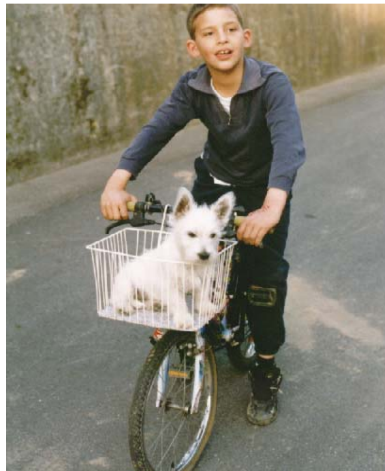
V košarici na kolesu ni najbolj užival