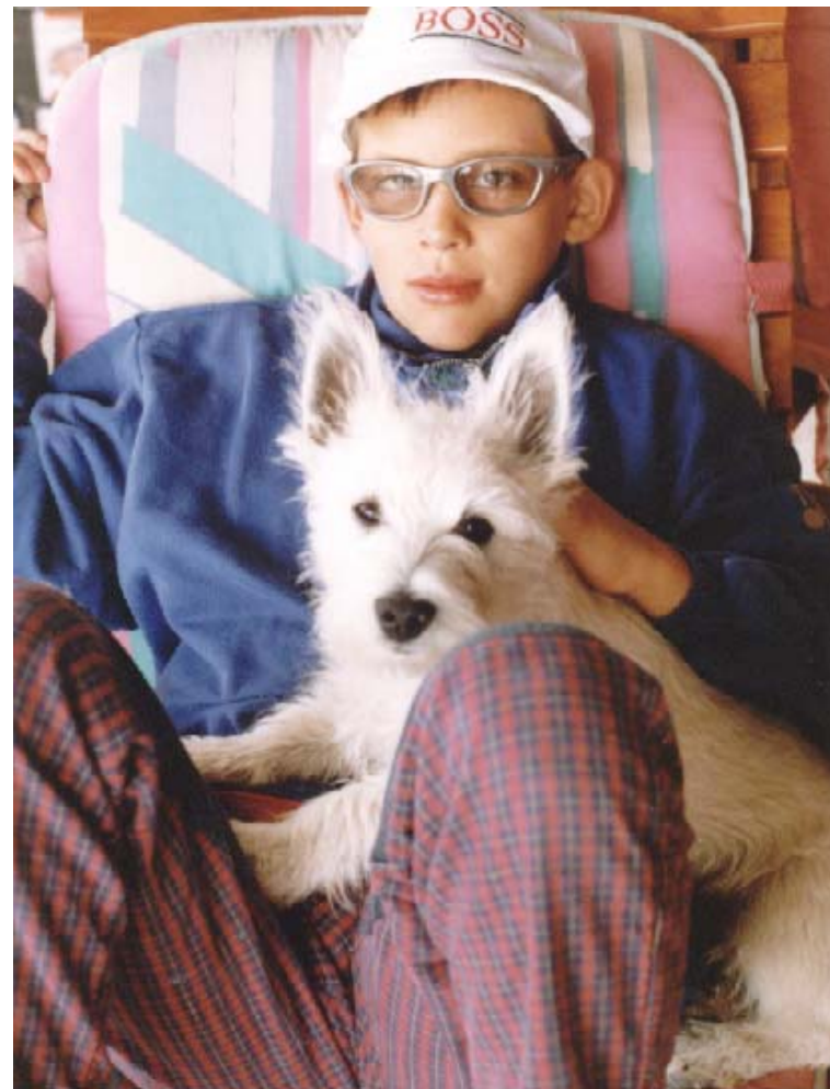
UPIJEVE ZGODBE napisal NIK ROVAN ob pomoči svojih staršev