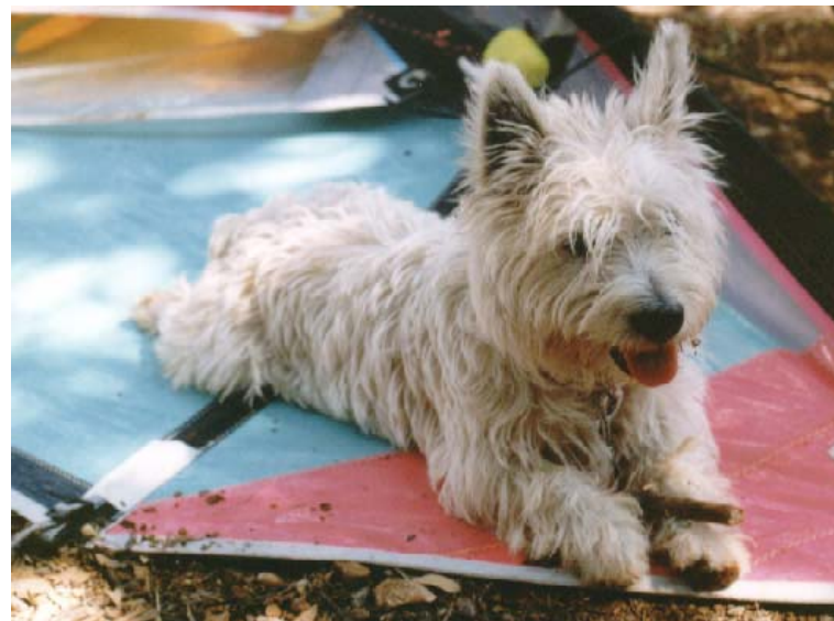
Upi je na morju najbolj užival na jadrju

Ko je bil star pol leta, smo bili na hrvaškem polotoku Pelješcu na Jadranskem morju. Z našim avtodomom smo bili v kampu in to čisto ob morju. Upi je zelo užival, saj je bil veliko spušččen, ker je bil kamp ograjen in se po njem niso dosti vozili z avtomobili. Zato je lajal na vse pse, ki so se sprehajali po avtokampu. Še najbolj pa na večjega psa, ki mu je bilo ime Amon in je bil iz Zagreba.