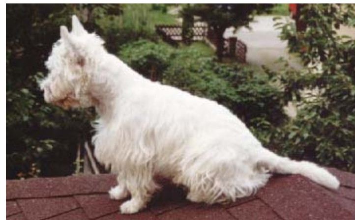
Zaljubljen spleza celo na streho in budno opazuje naokoli

V letu 2000 je Upi praznoval svoj drugi rojstni dan. Tokrat ni dobil torte, ker mu ni več do sladkarij, saj je zdaj star že 14 let, človeških seveda. Torej je v puberteti in se je z njim začelo nekaj dogajati. Opazili smo, da je postal zelo nemiren. Kar naprej sili iz hiše in bi bil rad zunaj, kjer vseskozi ovohava grme, drevesa, hišne vogale in druge stvari. Ko gre na sprehod trmasto vleče v svojo smer in nič ne poslušša, ampak gre po svoje. Tudi kričanje in lepa beseda ne zaležeta več, saj on vseskozi nekaj išče.