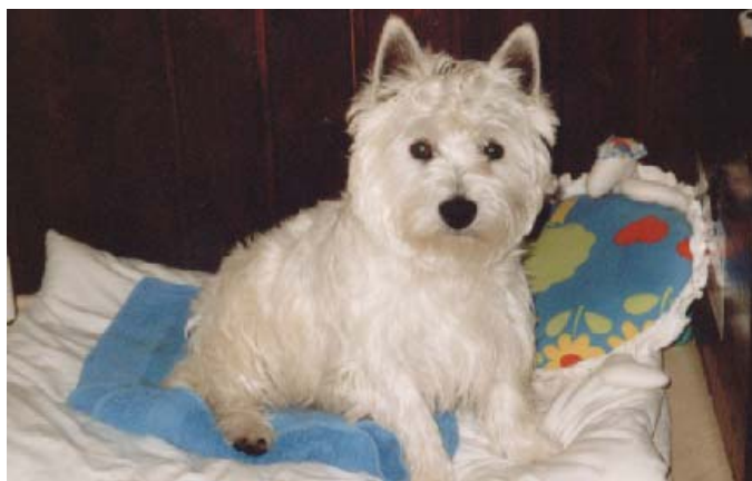
Upi ne more skriti, da je zaljubljen

Mislim pa, da Tina ni edina Upijeva ljubezen, saj je prijazen tudi do drugih psičk. Dobro se razume s sosedovo Medo, pa tudi druge, ki jih sreča, rad vidi in bi se rad z njimi igral. Očitno je v teh letih, da se hitro zaljubi, saj ne zdrži več veliko doma in bi samo hodil naokoli. Pa tudi, ko je v hiši stalno sili na balkon, na terasi pa burno preži, da ne bi kakšen pes ali psička slučajno šla mimo naše hiše.