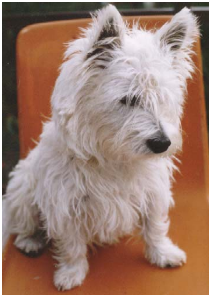
Upi zna tudi pozirati (star leto in pol)