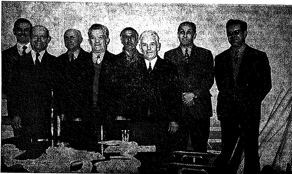
Kot je v navadi so se tudi letos, upokojeanci, ki so odšli v pokoj po 1. septembru 1972, fotografirali na svoji slavnosti, skupaj s predstavniki podjetja in DS. Kratko poročilo berite na 2. strani.

— z družbenim dogovorom je treba do stanovanjskih kreditov zavzeti tak odnos, da ne bo mo-