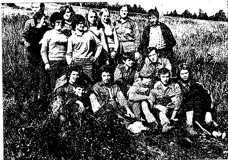
Pot je bila naporna, obrazi pa so kljub temu veseli.

V Mojstrani smo zavili v dolino Vrat. Ustavili smo se pri slapu Peričnik. Z lesenega mostu smo občudovali slap in njegovo okolico. Nato smo se odpeljali do Aljaževega doma. Ta je že 1015 metrov visoko. Po kratkem počitku in zajtrku smo krenili proti vrhu. Kmalu smo naleteli na prve krpe snega. Tega je bilo vedno več. Nazadnje že ni bilo nobene gazi. Vodiči so nas vodili ob markacijah, ki so označene na vidnejših skalah. Pot je bila težka in strma, razgled pa vedno lepši. Hodili smo že več kot dve uri. Izenada sta