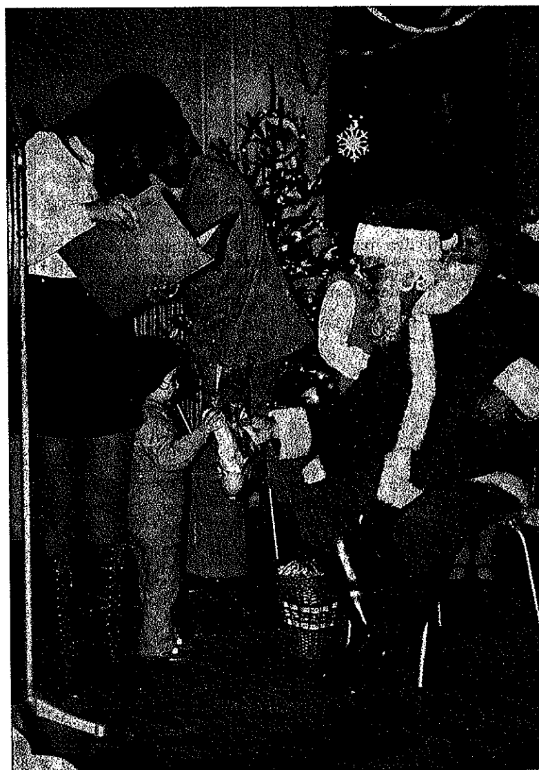
Za največji otroški praznik je tokrat Dedek Mraz prvič obiskal tudi PIONIRJEVE najmlajše v Novem mestu. Na sliki vidite prizorček s prirsčne prireditve v dvorani Samskega doma v Novem mestu, h kateri je v pripravah veliko pripomogla tudi mladinska organizacija.